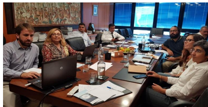
Figura 4- Os membros do consórcio na última reunião de projeto. // Figure 4- Members of the consortium during last meeting

The 31st of October, the project ended officially. However, the project partners will keep on working in the coming months to disseminate the results and make them available to society. It has been an exciting work of 2 years, where partners from 4 countries learnt from each other and set common rules for the shellfishing activity. The members of the consortium are grateful to the Portuguese Erasmus+ Agency to be given the opportunity to develop this training program, and they hope this work helps to improve the sustainability in the shellfishing sector.