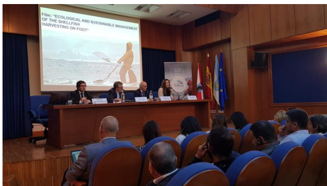
Figura 2- Apresentação do projeto em Vigo.// Figure 2- presentation of the project in Vigo

The consortium has published the training program they have been working on. It is available in the project website: http://www.ecofilmshellfishing.lpn.pt/ in the section "Toolbox". It is composed by 5 videos available in English, Spanish, Italian, Portuguese and Turkish."