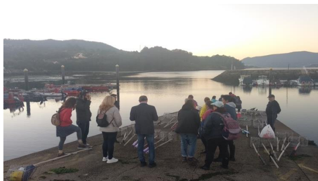
Figura 3 – Visita aos mariscadores da Ria de Vigo. // Figure 3- Partners visiting the shellfishers in Ría de Vigo

other events the 2nd, 12th and 24th October in Lisbon (Portugal), Cattolica (Italy) and Vigo (Spain) respectively.