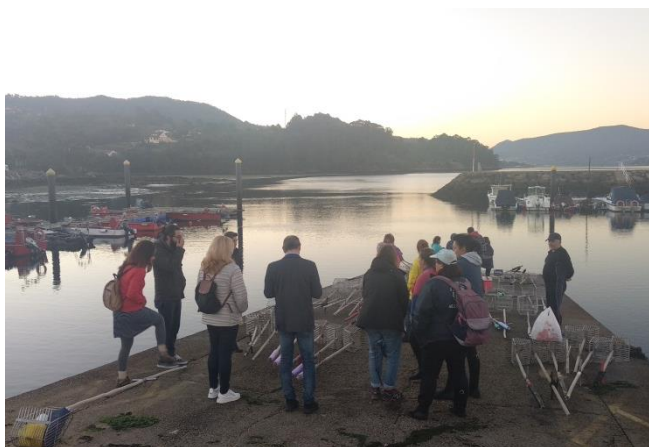
Imagen 3- Los socios visitando los mariscadores en la Ría de Vigo.// Figure 3- Partners visiting the shellfishers in Ría de Vigo