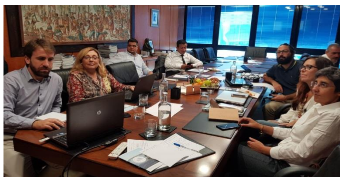
Imagen 4- Miembros del consorcio durante la última reunión // Figure 4- Members of the consortium during last meeting

septiembre en Rize (Turquía), seguido de otros eventos el 2, 12 y 24 de octubre en Lisboa (Portugal), Cattolica (Italia) y Vigo (España) respectivamente.